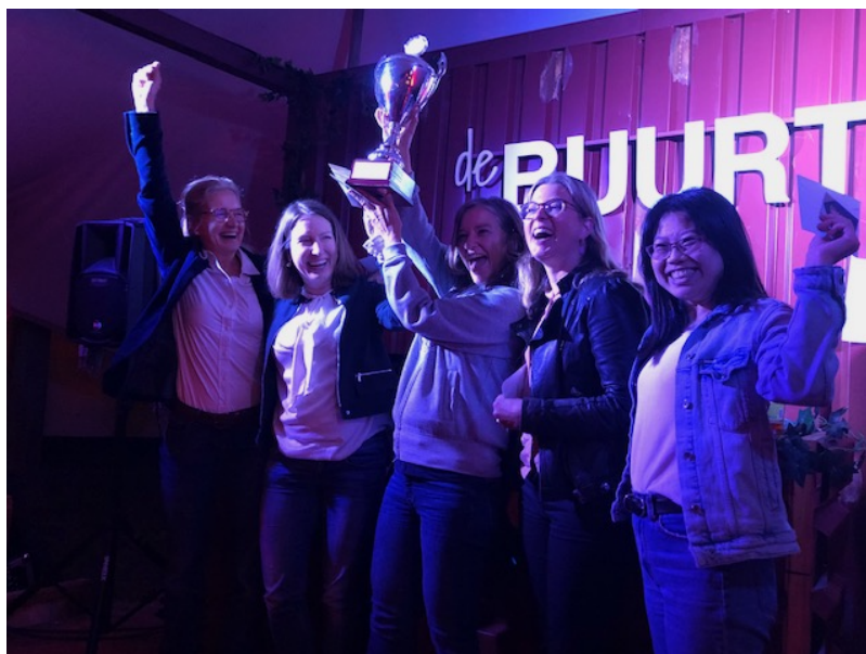
Het winnende team

Beste China-quizzers en geïnteresseerden,